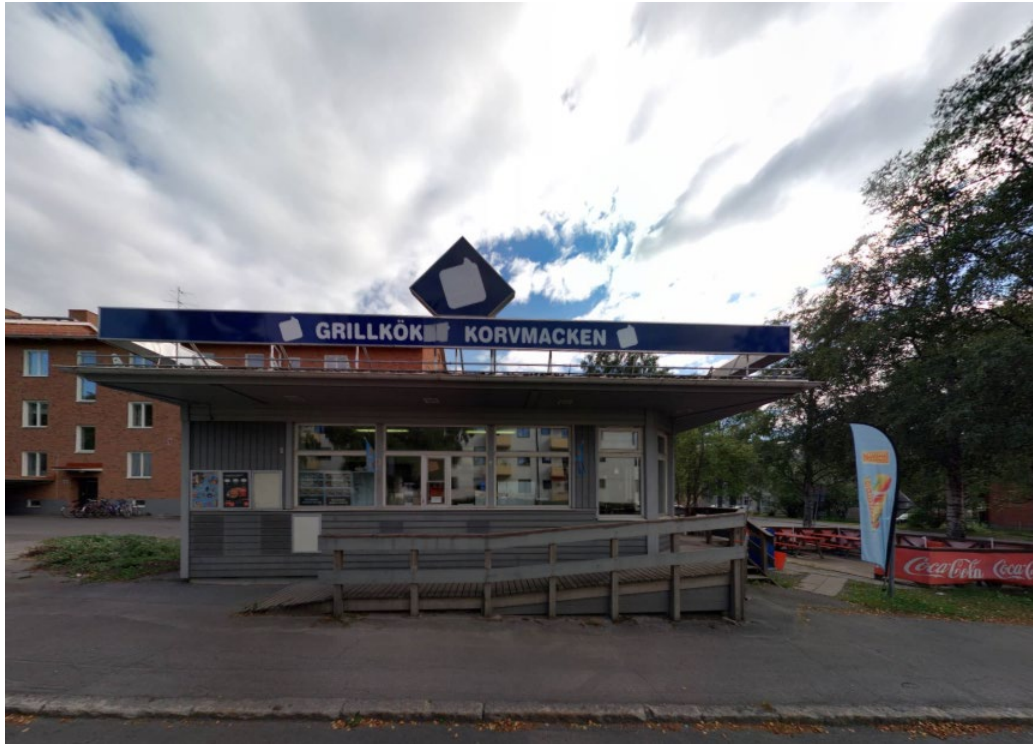
Gatuköket som det ska bildas en egen fastighet för.