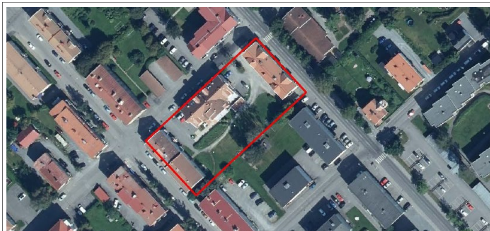
Karta över planområdet.

Syftet med att ta fram en detaljplan är att möjliggöra uppförande av ytterligare ett bostadshus inom Brevbäraren 2, samt delar av Brevbäraren 3. Det nya bostadshuset avses inrymma LSS-bostäder i två våningar plus suterräng, men även andra bostadsformer är möjligt.