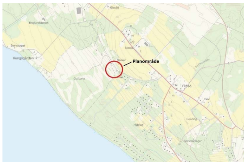
Karta över planområdet

Syftet med att ta fram en detaljplan är att möjliggöra avstyckning för 6 nya bostadstomter i anslutning till golfbanan på Frösön. Tomterna ska uppföras längs vägen från det befintliga klubbhuset, norr om golfbanan inom fastigheten Kungsgården 5:2. Utformning av bebyggelsen ska ske med stor hänsyn till platsens unika kulturmiljö, och anpassas till naturvärden kopplat till den närliggande jordbruksmarken.