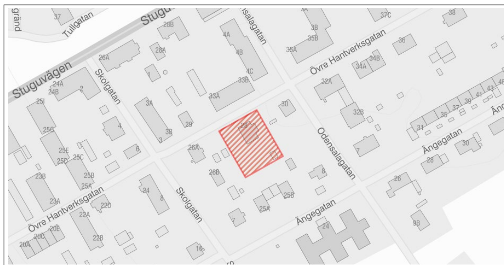
Karta över planområdet