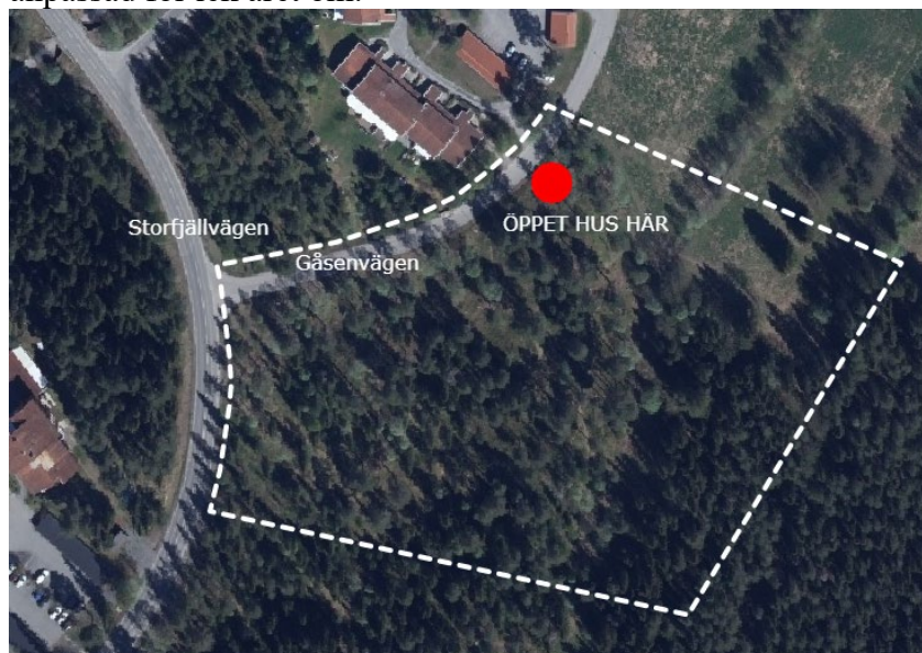
Karta över planområdet och plats för samrådsmöte.

Syftet är också att förskoletomten ska tillgodose behovet av minst 40 kvadratmeter friyta per barn, men även rymma övriga funktioner som hämta/lämna zon, parkeringsytor, ytor för varutransporter och leveranser. Detaljplanen ska också skapa förutsättningar för en förskolegård som nyttjar områdets befintliga topografi och vegetation för att skapa en varierande utemiljö som erbjuder möjlighet till olika typer av lek, rekreation och pedagogisk verksamhet. Gården ska erbjuda både soliga och skuggiga platser och vara väl anpassad för lek året om.