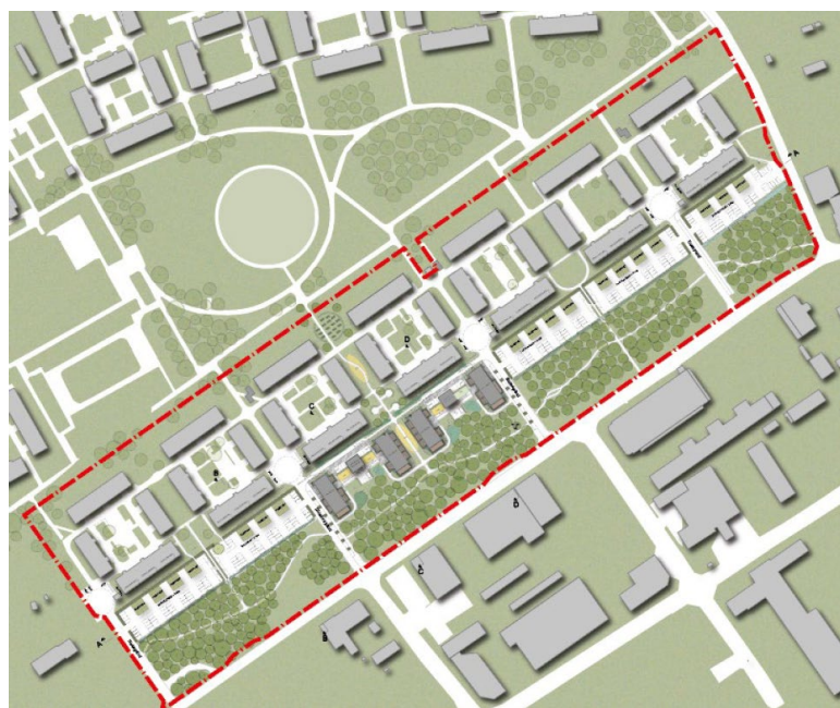
Illustrationskarta som visar den förtätning som samrådsförslaget möjliggör, nya bostadshus i mörkgrått.

Syftet med att ta fram en detaljplan är att möjliggöra förtätning av Körfältet med nya flerbostadshus, att omstrukturera parkeringsytor och att bevara större delen av naturområdet längs Inspektörsvägen.