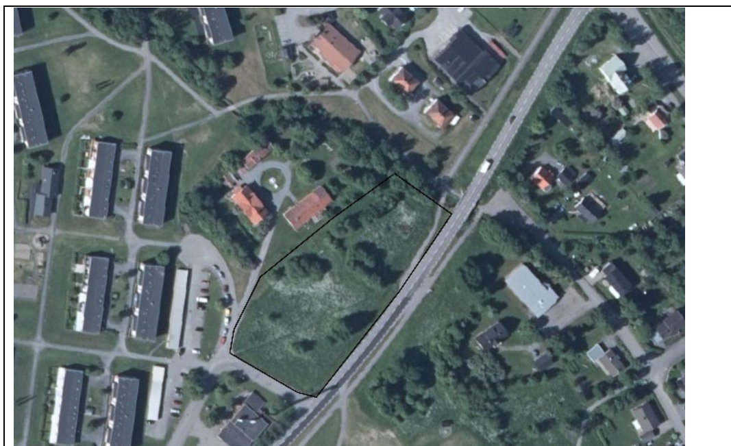
Karta över planområdet

Om du inte senast under granskningstiden har framfört dina synpunkter skriftligt och uppgett namn och fullständig adress kan du förlora rätten att senare överklaga kommunens antagandebeslut.