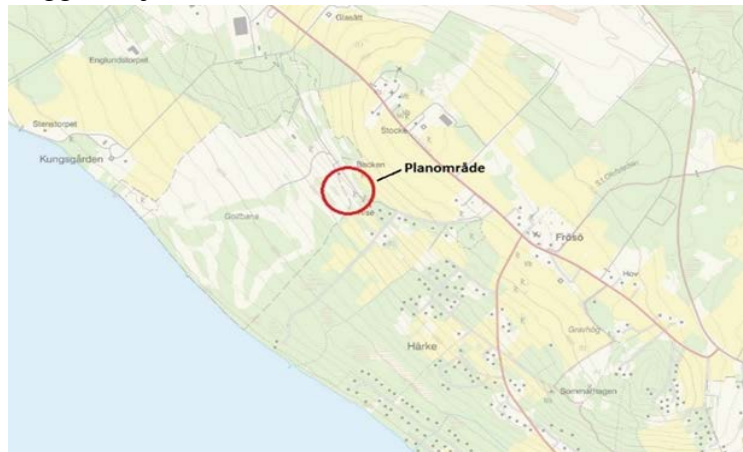
Karta över planområdet

Syftet med att ta fram en detaljplan är att möjliggöra avstyckning för 6 nya bostadstomter i anslutning till golfbanan på Frösön. Tomterna ska uppföras längs vägen från det befintliga klubbhuset, norr om golfbanan inom fastigheten Kungsgården 5:2. Utformning av bebyggelsen ska ske med stor hänsyn till platsens unika kulturmiljö, och anpassas till naturvärden kopplat till den närliggande jordbruksmarken.