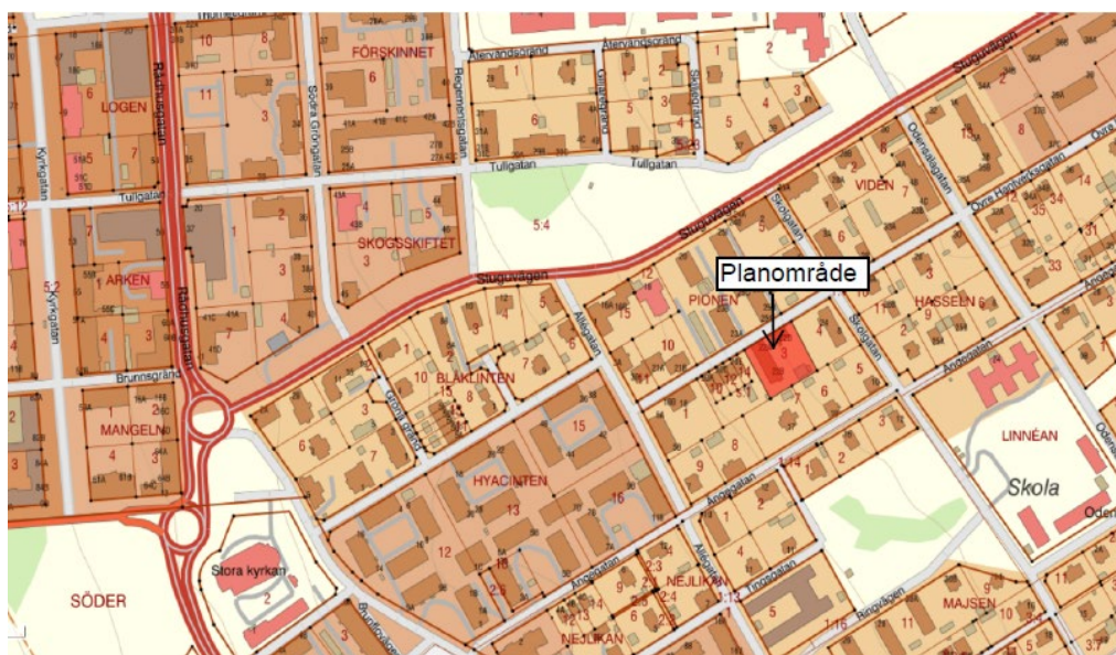
Karta över planområdet

Syftet med planarbetet Syftet med att ta fram en ändring av detaljplan är att göra det möjligt att stycka av fastigheten Konvaljen 3 till två bostadsfastigheter. Fastigheten omfattas av en tomtindelning som hindrar alla former av förändringar av fastighetsindelningen och genom planförslaget upphävs den del av tomtindelningen som omfattar fastigheten Konvaljen 3.