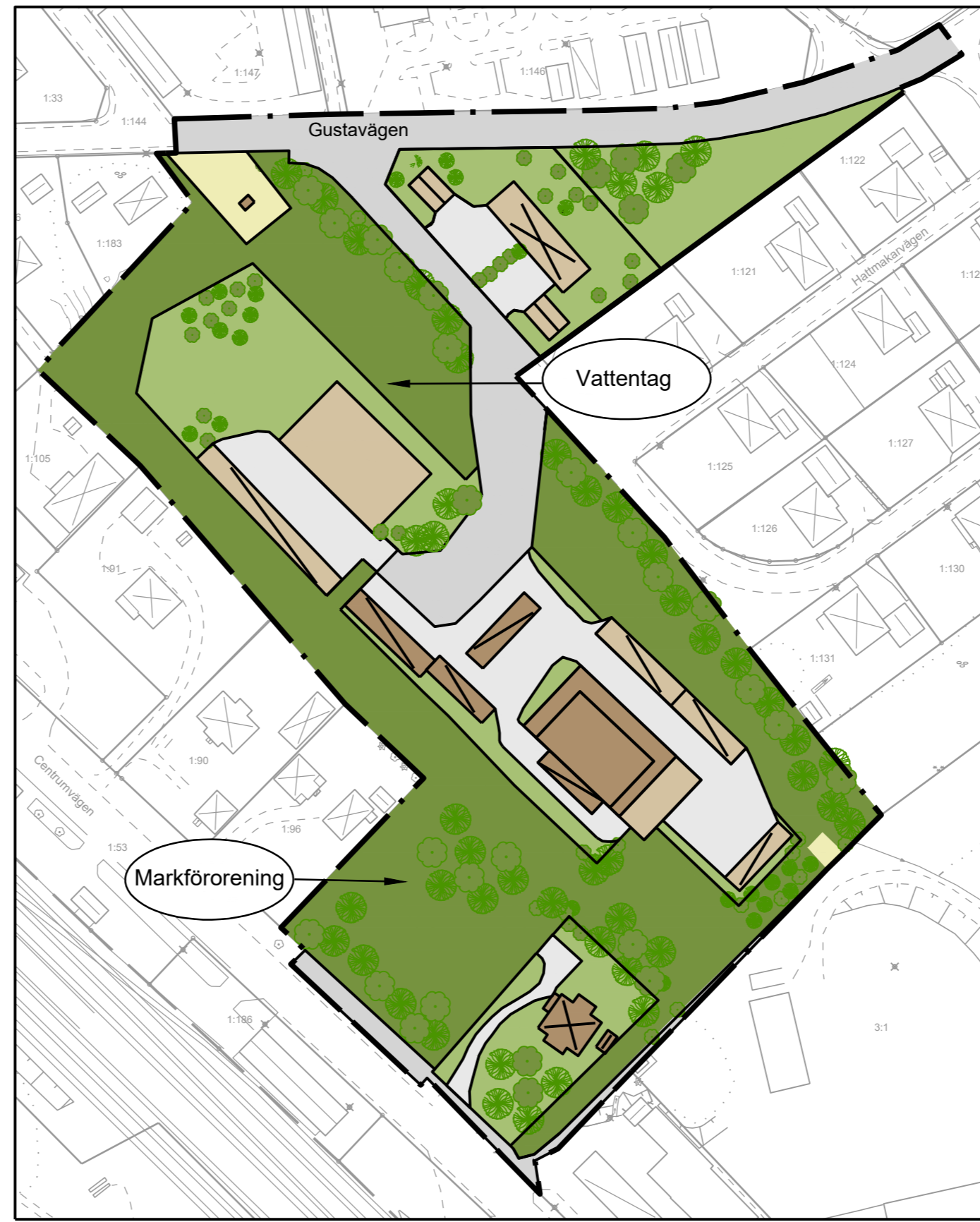
Exemplet visar par-, rad eller kedjehus i norra delen av planområdet medan en kontors- och vårdbyggnad visas i södra delen.