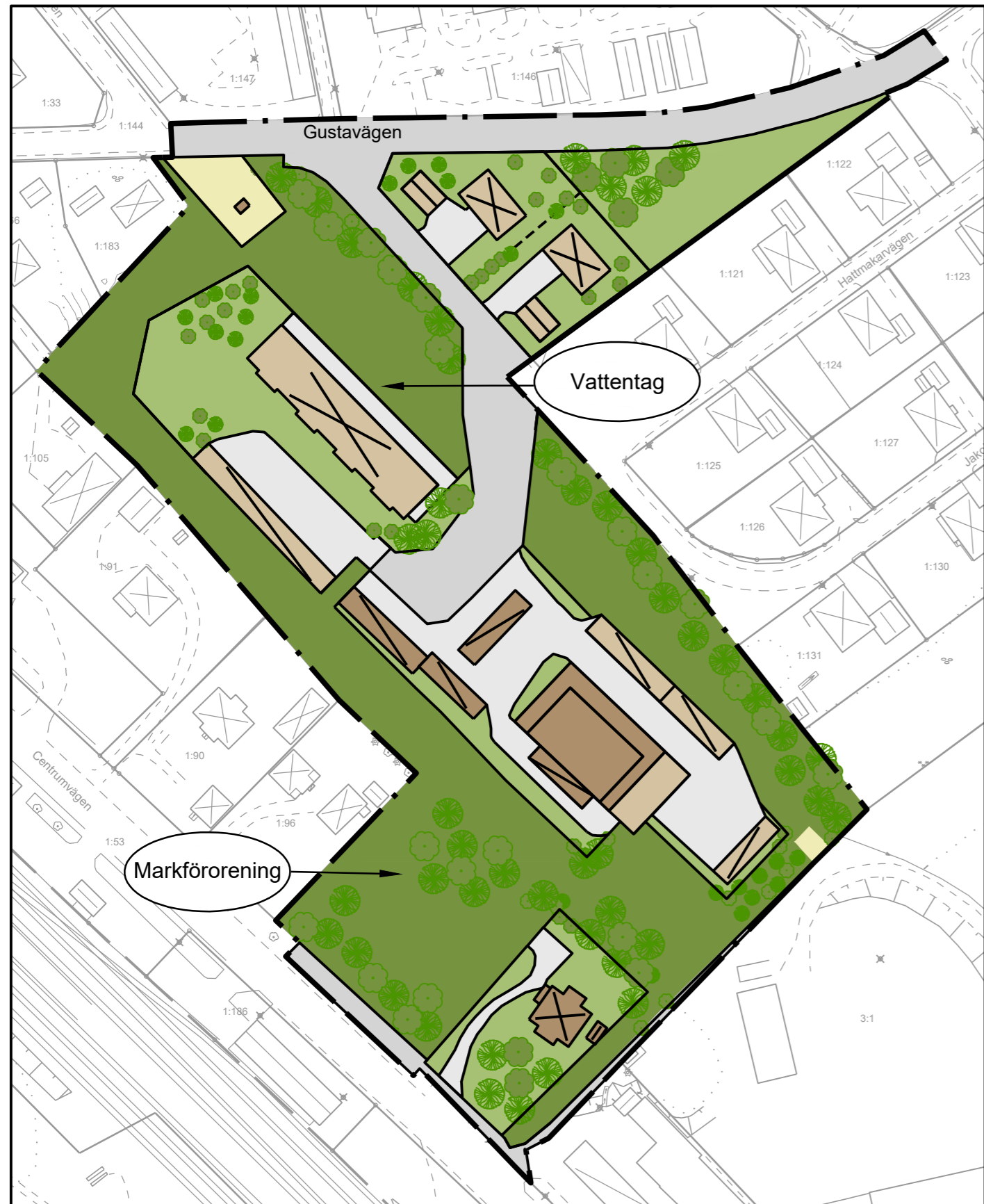
Exemplet visar friliggande småhus i norra delen av planområdet medan flerbostadshus visas i södra delen.