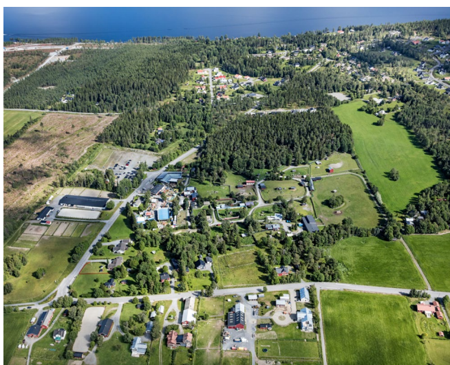
Flygbild över fd Frösö Zoo och dess omgivningar

Ett detaljplaneprogram är ett förskede till den ordinarie detaljplaneprocessen som syftar till att i ett tidigt skede klargöra planeringsförutsättningar och ange inriktning och mål för den vidare planeringen. Programhandlingen redovisar övergripande planeringsförutsättningar och presenterar ett översiktligt utvecklingsförslag för området.