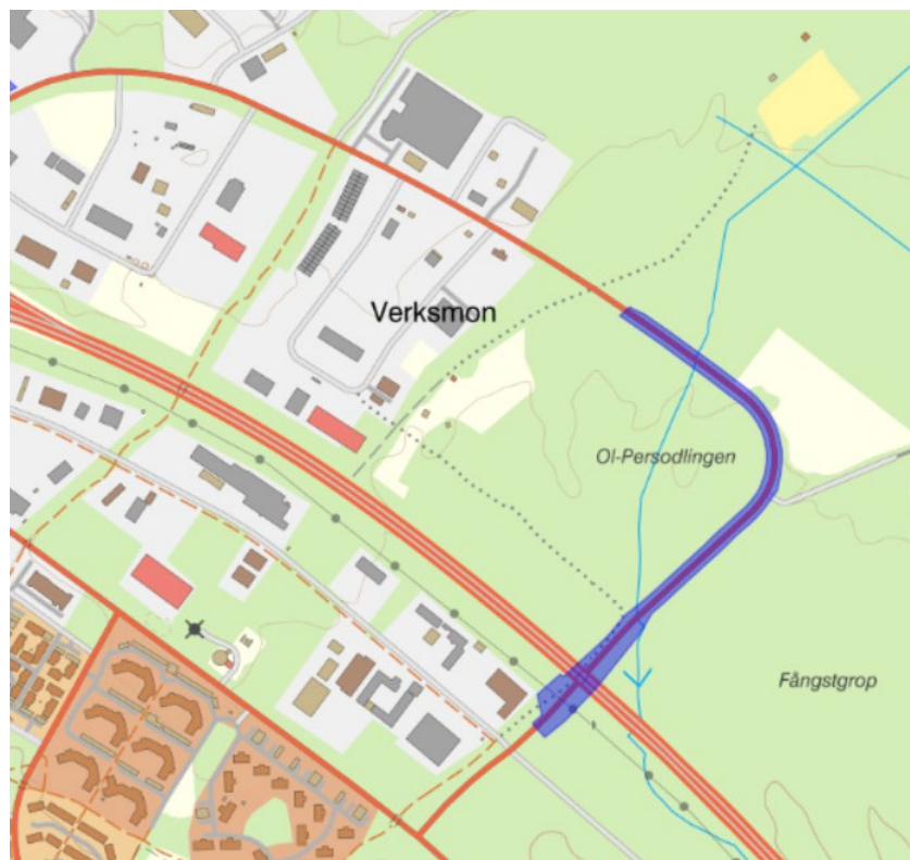
Karta över planområdet (markerat i blått).

Planen syftar även till att möjliggöra en större underfart under E14.