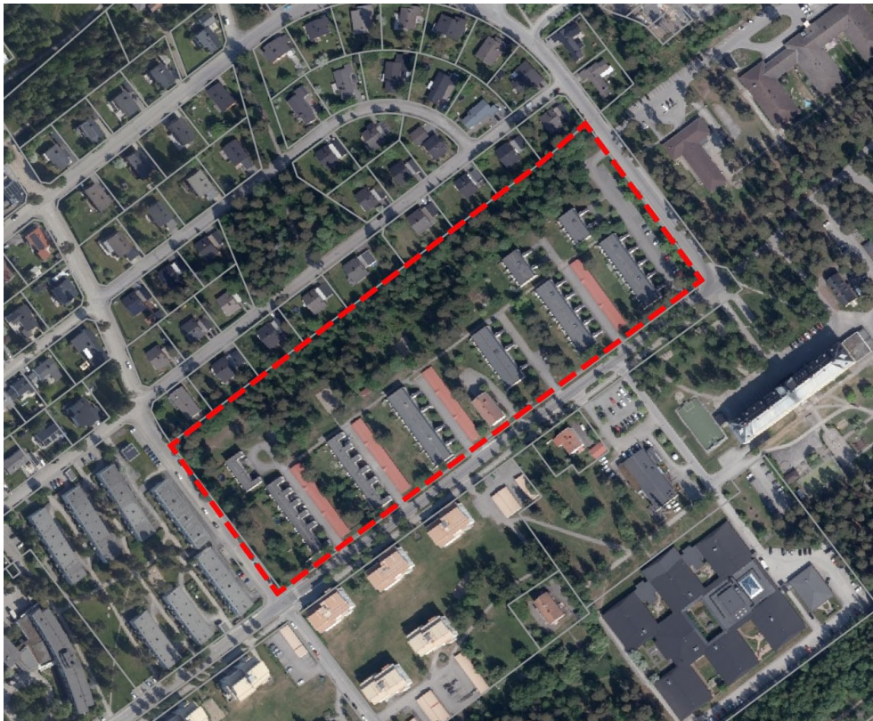
Översiktskarta. Planområdet är markerat med röd streckad linje.

Planområdet är beläget i stadsdelen Karlslund och består av del av fastigheten Fjällkon 6. Planområdet avgränsas av enbostadshusen längs Jaktstigen åt nordväst, Eriksbergsvägen i norr, Sollidenvägen åt sydöst och Grindstugevägen åt sydväst. Området är cirka 4 hektar.