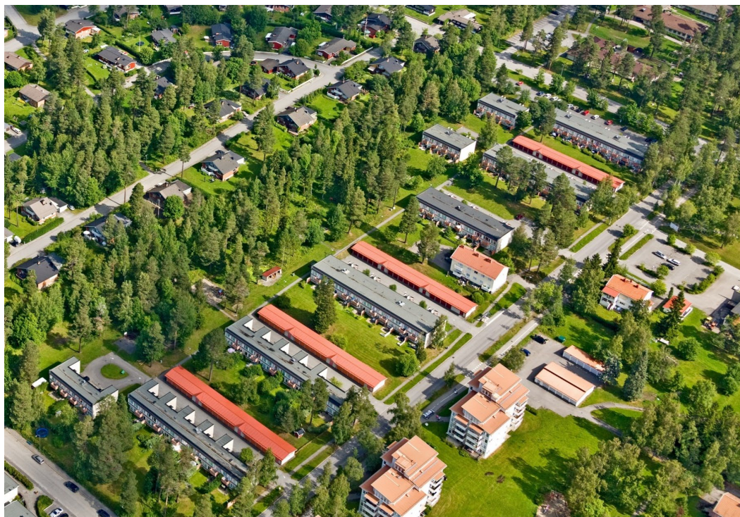
Flygbild som visar planområdet.

Insprängt i skogsmarken finns sociala funktioner som lekplats, fotbollsplan och bänkar. En stig löper genom området i nordöstlig/sydvästlig riktning. Hela planområdet ägs av Landstingsbostäder.