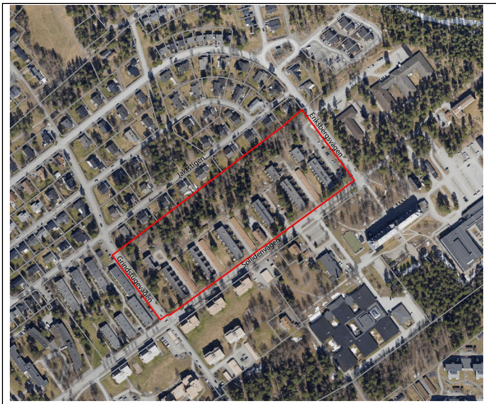
Karta över planområdet.

Syftet med att ta fram en detaljplan är att möjliggöra förtätning av bostäder i form av enbostadshus och radhus/kedjehus inom fastigheten Fjällkon 6.