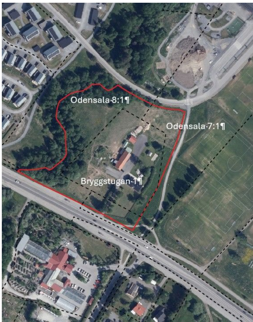
Karta över planområdet