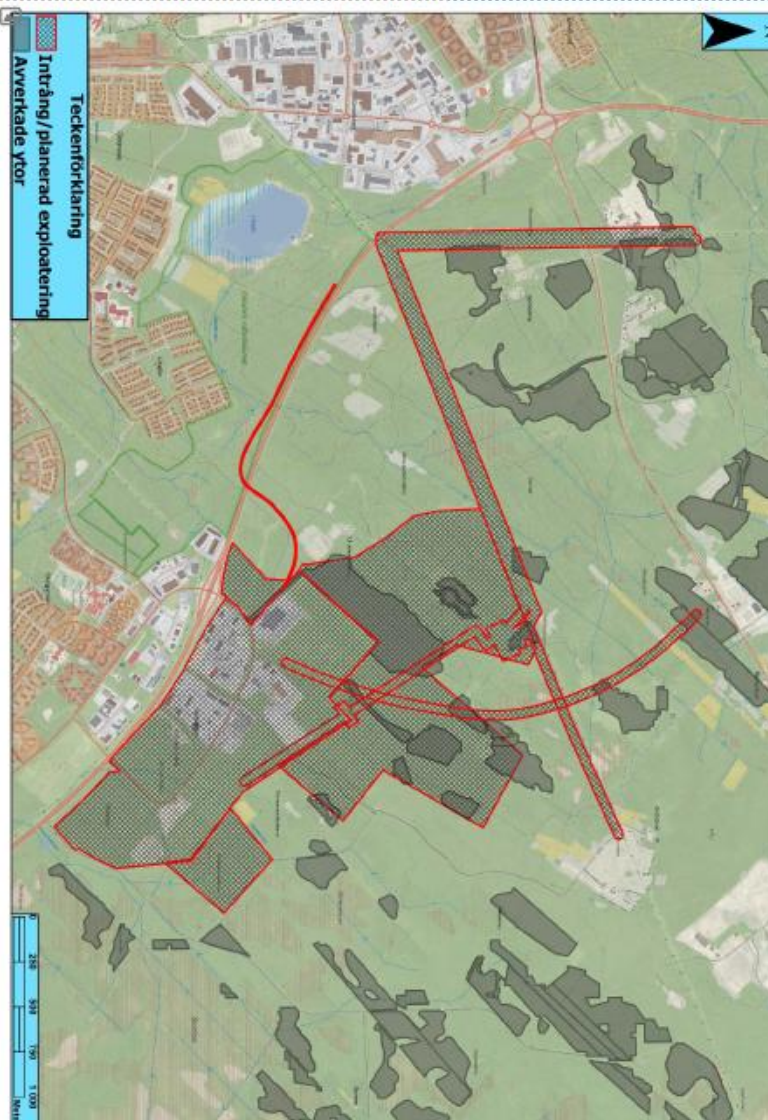
FIGUR: Sammanställning av påverkade ytor: industrimark, avverkningar, elinfrastruktur, planerad godstrafik.

Yttrande fördjupad översiktsplan Södra Östersund Rädda Spikbodarna ideell förening i Östersund