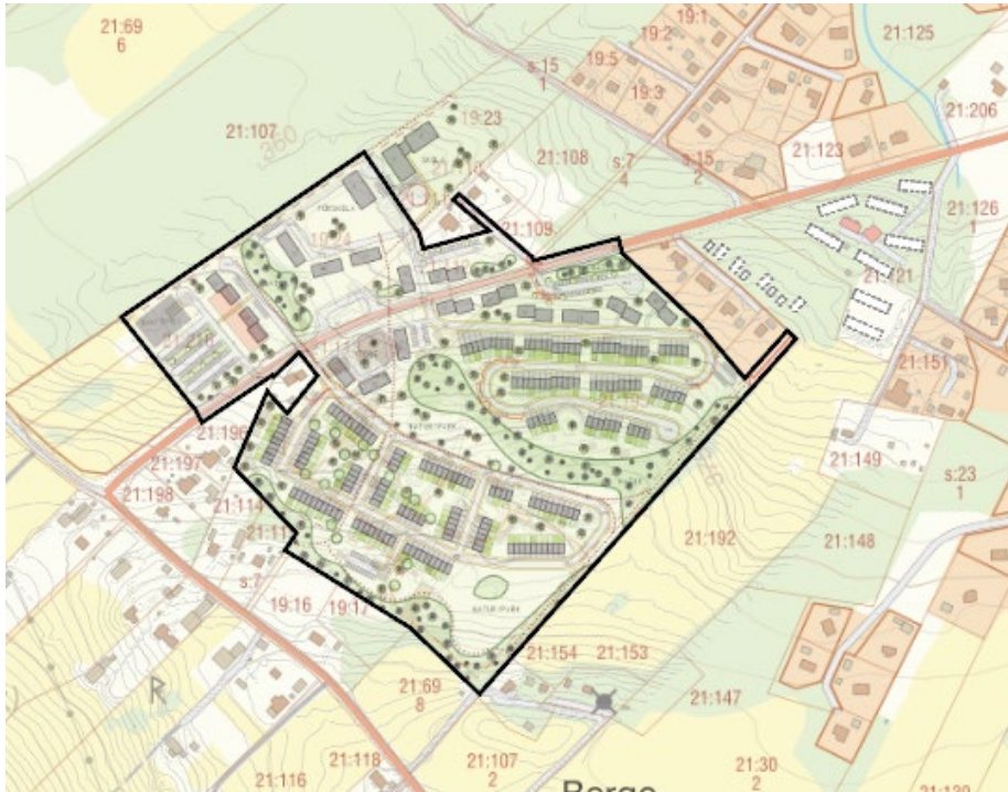
Aktuell skiss till illustrationsplan 220112

anslutning till naturområdena på Östberget, vid Ändsjön samt på norra Frösön.