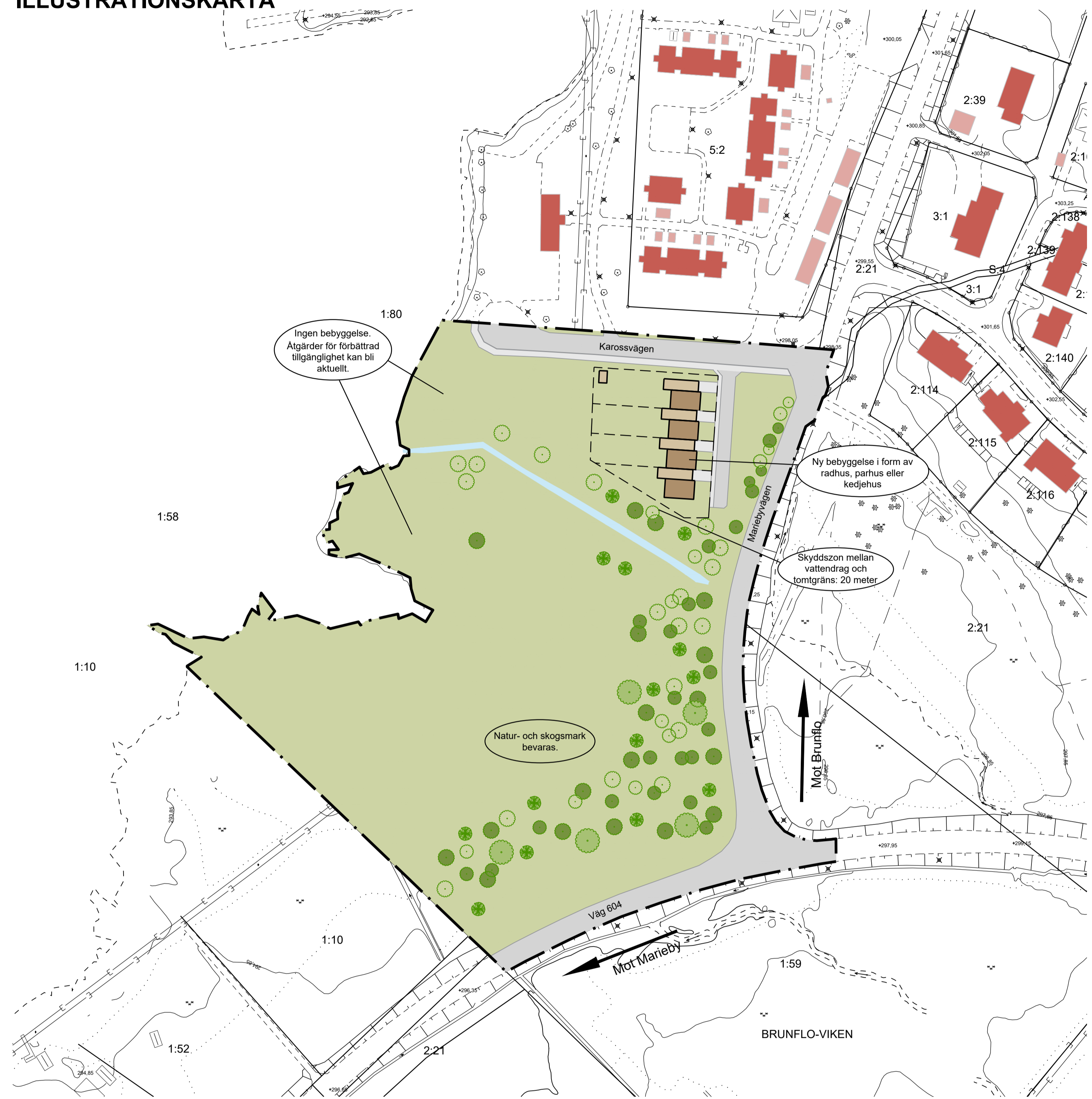
Förslag på möjlig utformning, alternativ 1.