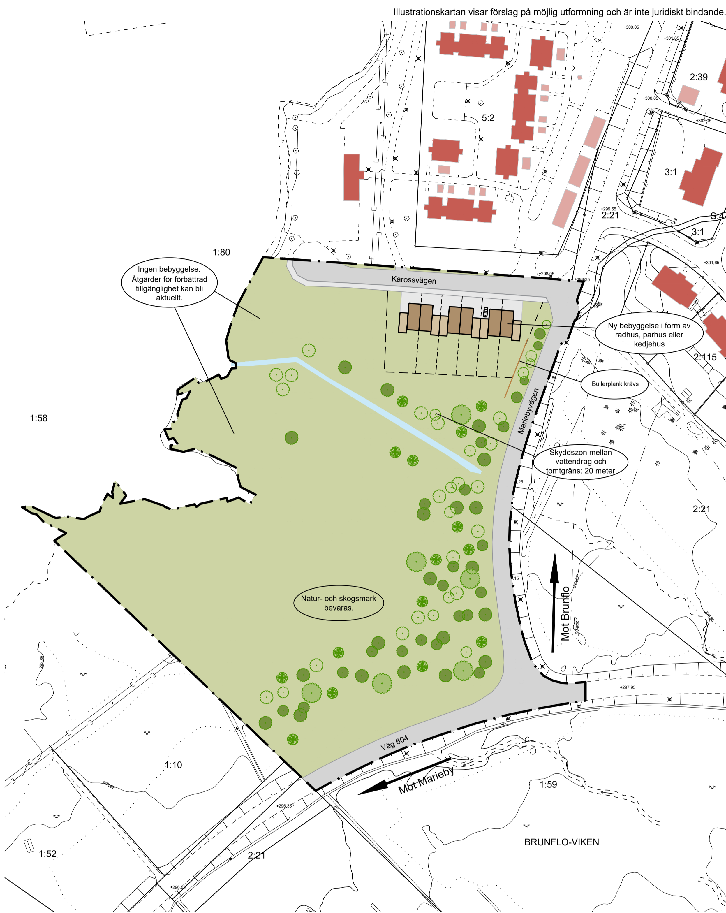
Förslag på möjlig utformning, alternativ 2.

Tillhör miljö- och samhällsnämndens i Östersund beslut den 2022-12-14 § 281 intygar: Caroline Frankow Versvåg Miljö- och samhällsnämndens sekreterare