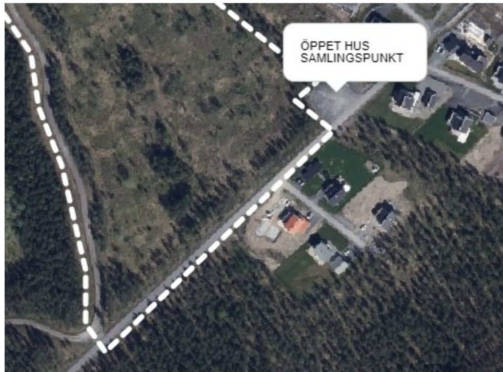
Karta som visar Samlingsplats för öppet hus vid parkeringen, Mosebacken.

Syftet med mötet är att ge information om förslaget och att ge möjlighet att ställa frågor och att lämna synpunkter.