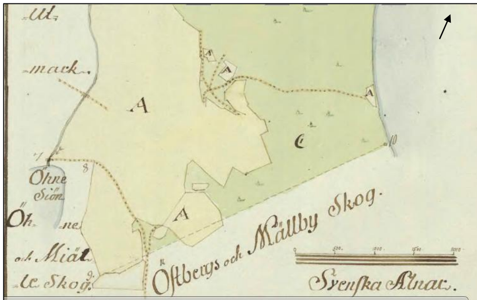
Figur 6. På 1780 års karta över Berge syns några av Frösöns äldre färdvägar. Sträckan mellan punkt 7 och 8 inom område A är av intresse för denna utredning. Ej skalenlig.

Vilken är då pilgrimsledens mest sannolika sträckning? På 1780 års karta över Berge är en av Frösöns äldre vägar karterad (figur 6).