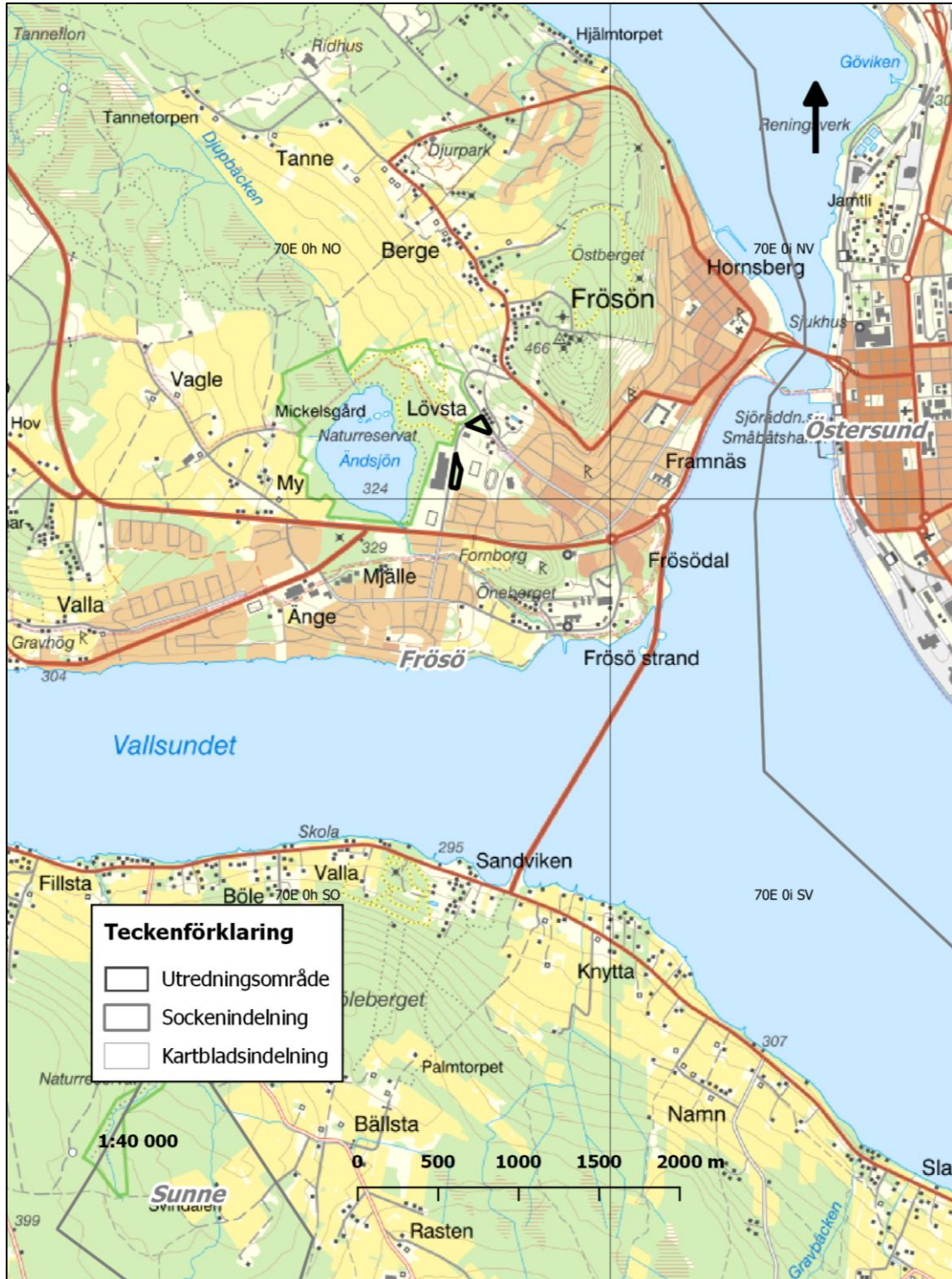
Figur 1. Utredningsområdets belägenhet i Lövsta, Frösö socken, Östersunds kommun, Jämtlands län. Skala 1:40 000.