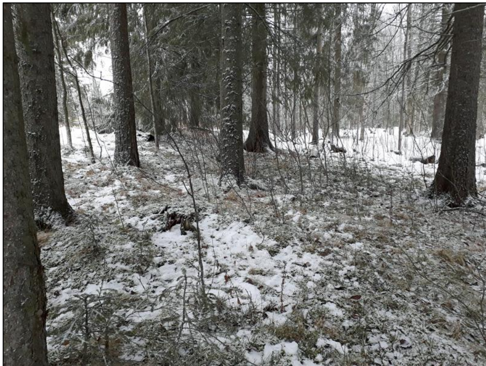
Figur 3. Utredningsområdets norra del. Vy mot ost-sydost. Foto AC2019-039-Z-0001.