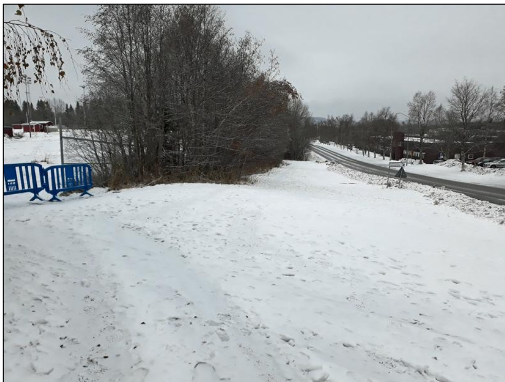
Figur 4. Utredningsområdets södra delområde, mellan Lövsta idrottsplats till vänster och Lövstavägen till höger. Vy mot söder. Foto AC2019-039-Z-0004.