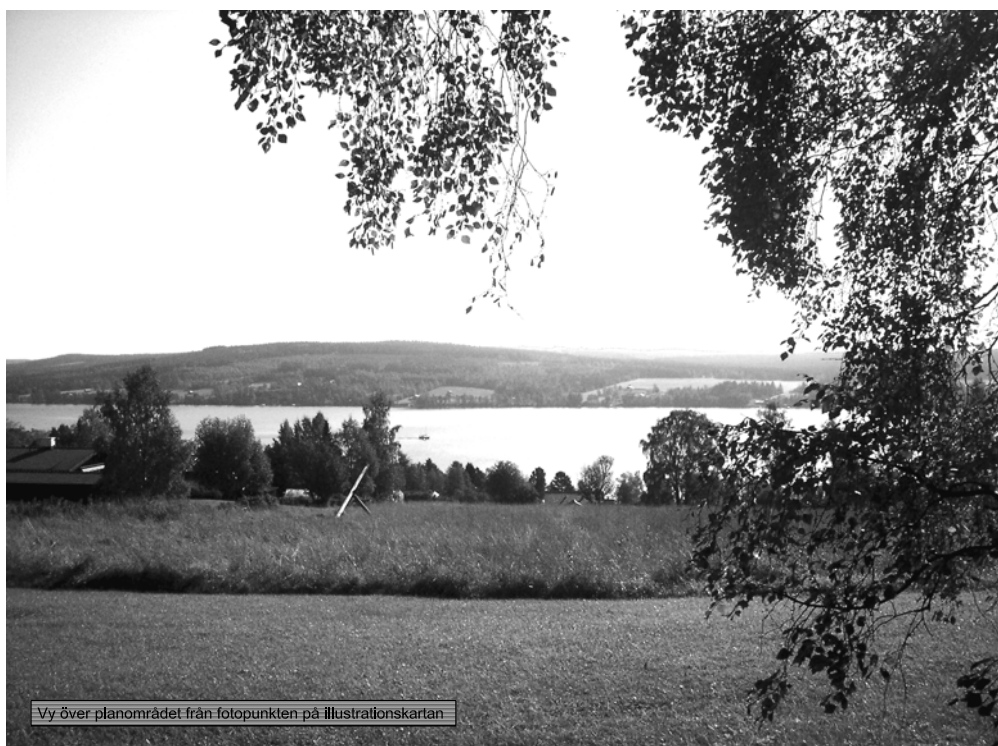
Vy över planområdet från fotopunkten på illustrationskartan