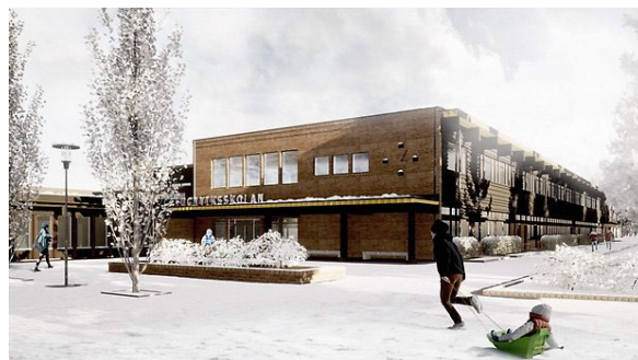
På bilden: skiss över "Nya" Lugnviksskolan