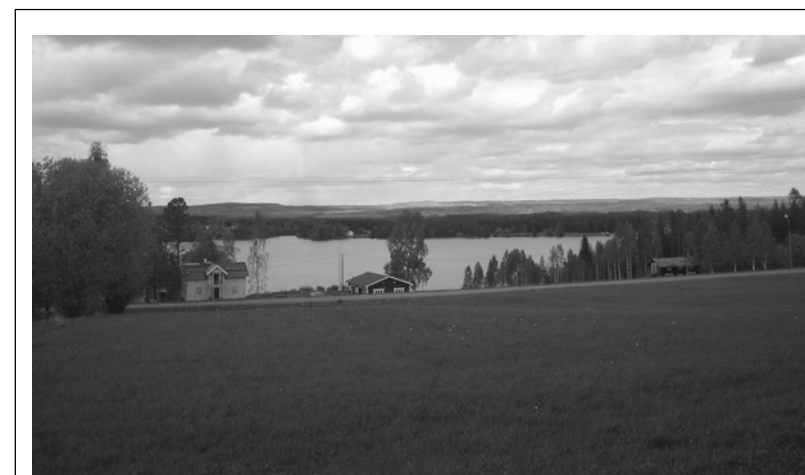
Utsikt från tomterna C och D

Planhandlingarna består av: - Plankarta med illustrationskarta samt bestämmelser, - Plan- och genomförande beskrivningar - Särskilt utlåtande.