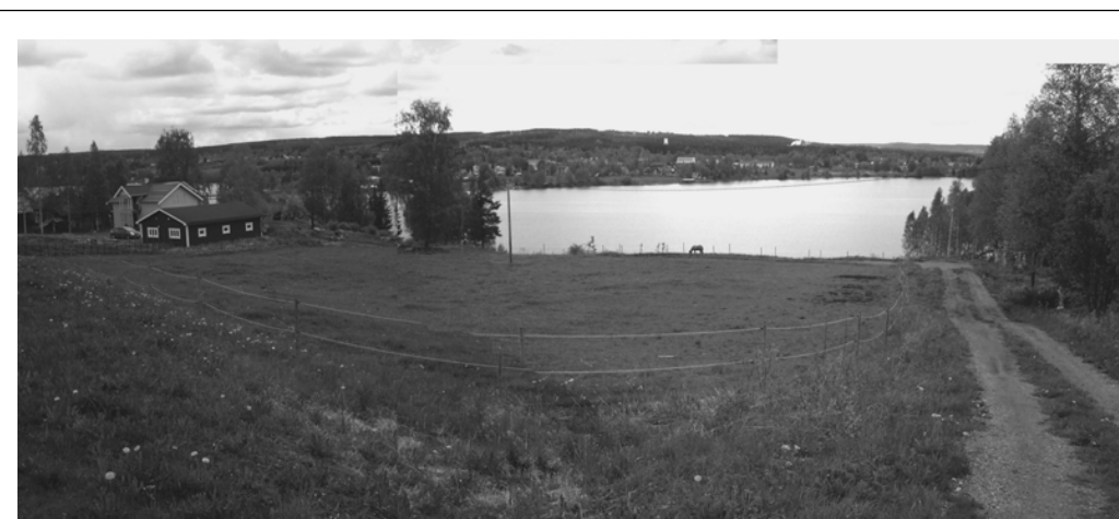
Utsikt från tomten F