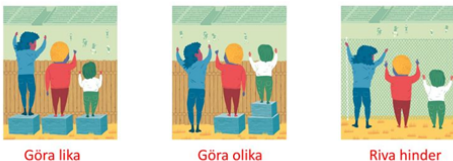
Bild 5. Bilden illustrerar proportionell universalism vilket betyder generella åtgärder som anpassats i omfattning utifrån behov och utformats utifrån olika gruppers behov. Det som är nödvändigt för några fungerar för fler.

tydliga samhällsvinster. Genom att göra rätt från början minskar behovet av individuella lösningar och dyra åtgärder för anpassningar i efterhand minskar. Det är många olika perspektiv och förutsättningar som behöver beaktas. Det som är nödvändigt för 10% av befolkningen, underlättar för 40% och är bekvämt för alla. Följande principer gäller för universell utformning likvärdig användning, flexibilitet i användning, enkel och intuitiv användning, uppfattbar information, tolerans för misstag, låg fysisk ansträngning, storlek och utrymme för åtkomst och användning. 37 Många produkter som tagits fram för att förenkla för några eller som hjälpmedel är idag norm, exempelvis dörrar som öppnar sig oavsett vem som närmar sig, vattenblandare på handfat, dataprogram som fungerar oavsett vilket språk som används. Universell utformning kan visa sig genom bostadsområden som utvecklas för att vara socialt hållbara – som motverkar boendesegregation och främjar trygghet, tillit och en god och jämlik hälsa. Där olika grupper känner sig jämlika och kan vara en delaktiga.