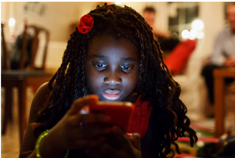
Bild 9. Barn tittar i sin mobiltelefon.

Egenmakt – det som på engelska kallas empowerment – handlar om att en individ eller grupp tar makt och kontroll över sina egna omständigheter, situationer och mål. Det är inte en huvudorsak till att göra barn delaktiga, men är ofta en positiv effekt som är värd att lyfta fram. Att få vara delaktig och ta plats i en beslutsprocess bidrar ofta till en känsla av egenmakt hos de barn som medverkar. På samma sätt blir detta något som saknas för de grupper av barn som återkommande gånger exkluderas. Genom att synliggöra och stärka grupper som har en svag röst och sällan ges inflytande, påverkas barnen ofta positivt. Genom deras delaktighet och inflytande kan självkänslan stärkas, deras handlingsutrymme i förhållande till sitt eget liv kan öka, och många upplever en större tillit till vuxna.