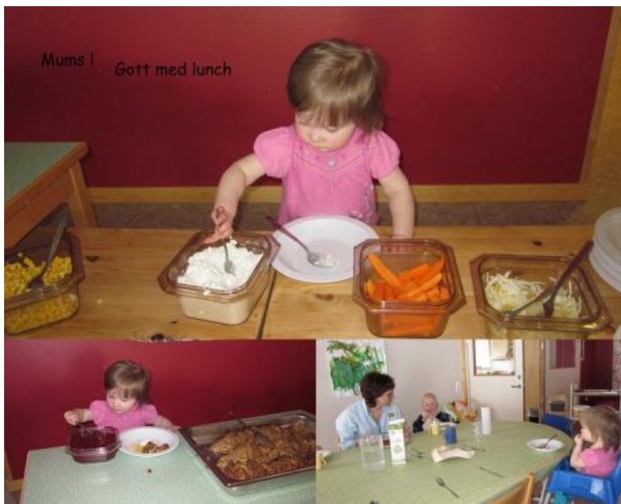
Lunchbuffé hos de yngsta barnen

Mål 4: Att barnen ska få tillfällen att prova på olika fritidsaktiviteter/sporter.