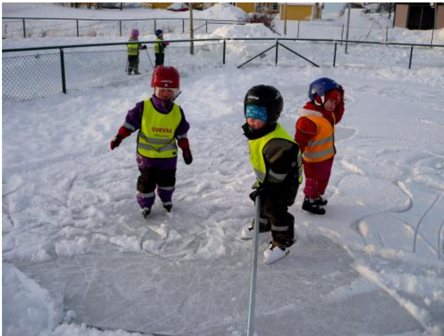
Förskolebarnen åker skridskor.

Mål 2: Att barn/elever och personal på skolan/förskolan ska bli bättre på att sopsortera och i förlängningen ta med sig sina kunskaper hem.