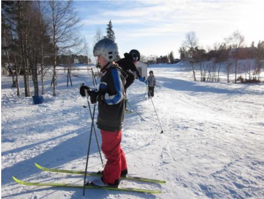
Skidor i backe.