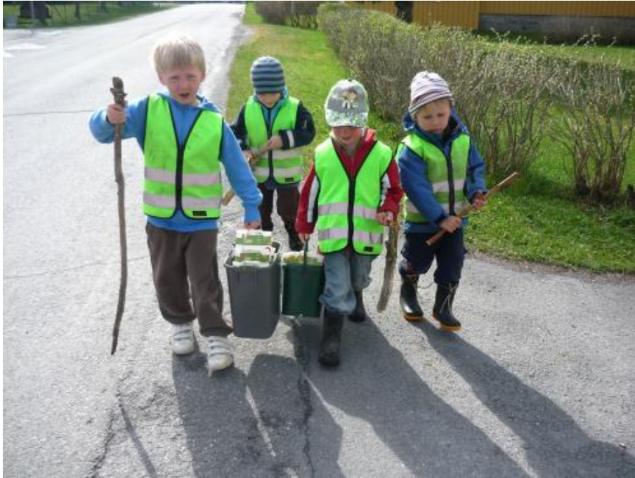
På väg till miljöstationen....

Mål 3: Att barnen får en vana att äta näringsriktigt, miljömässigt (arbetsmiljö och globalt) och regelbundet.