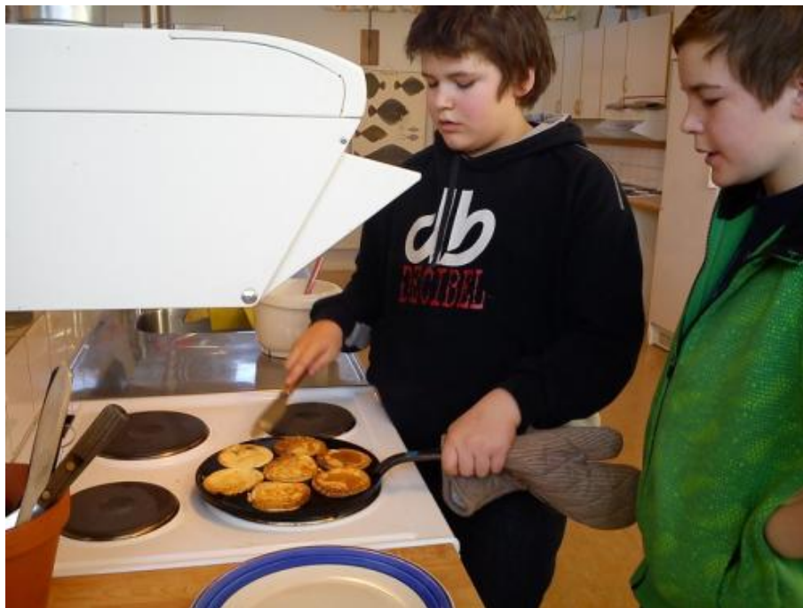
Hemkunskap i klass 5