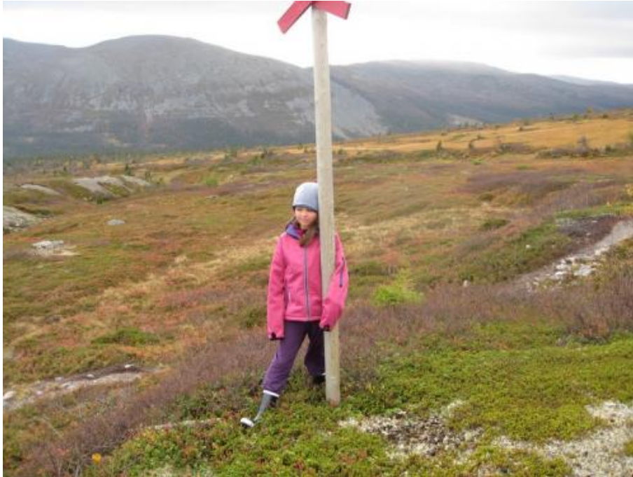
Fjälltur med hela skolan i tvärgrupper.