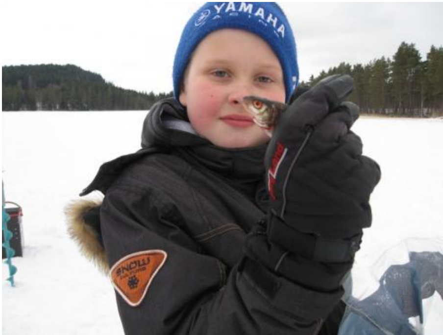
Alla elever fick fisk på pimpelturen.