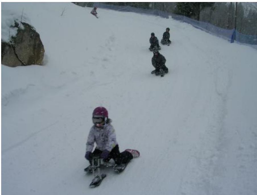
Full fart i källkbanan