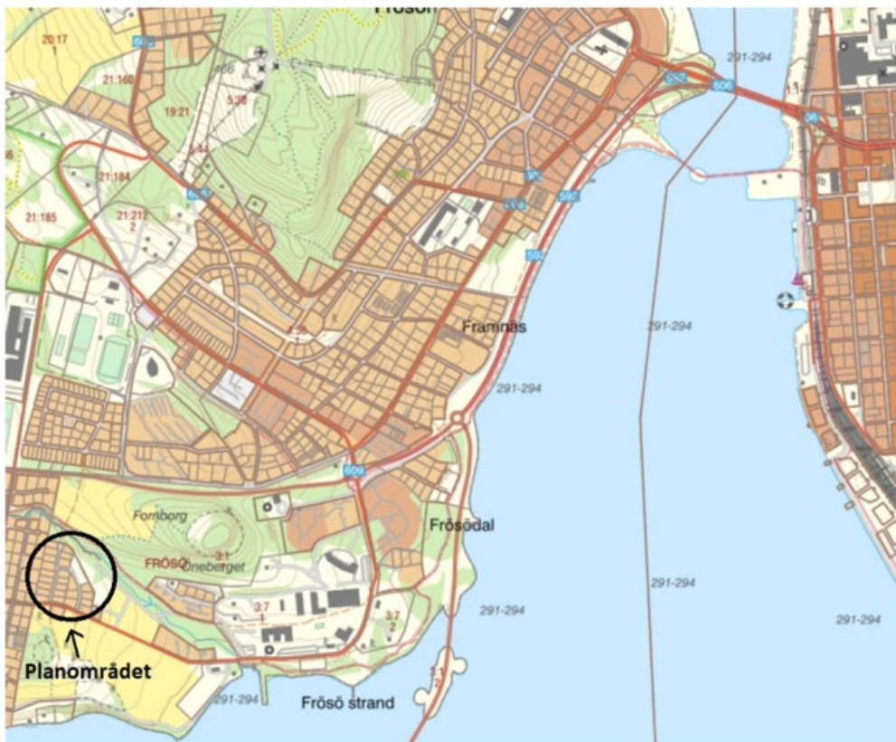
Karta över planområdet