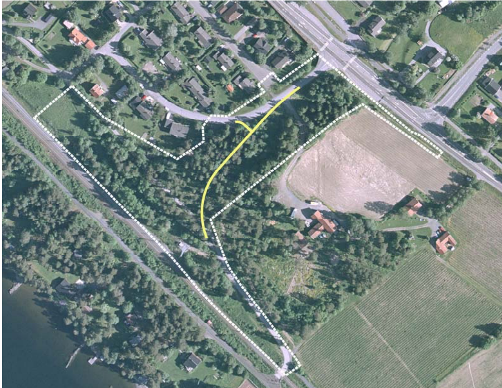
Planområdet med planerade vägsträckning Nedre Andalsvägen -Torvollsvägen