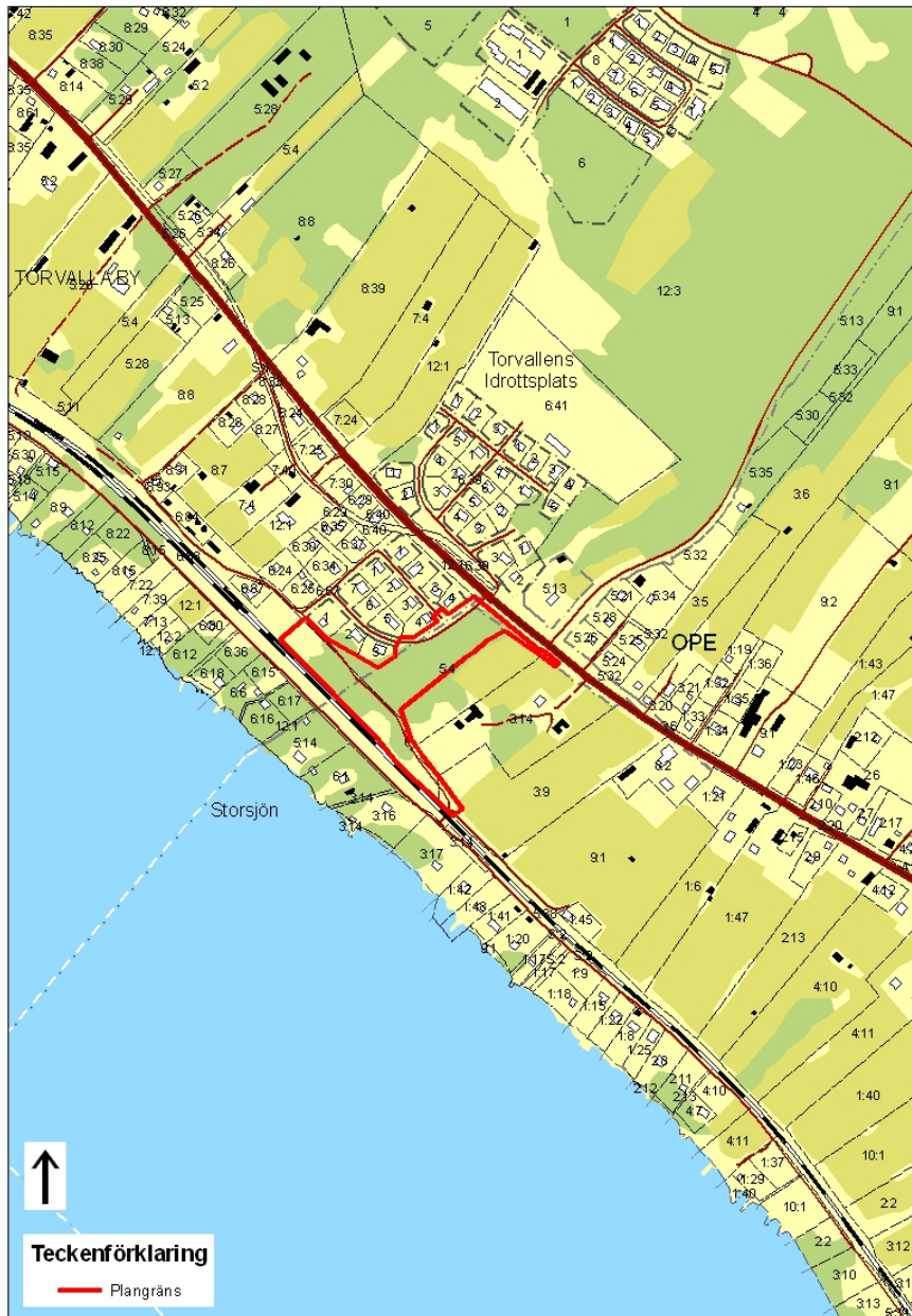
Planområdets läge söder om Nedre Andalens villaområde