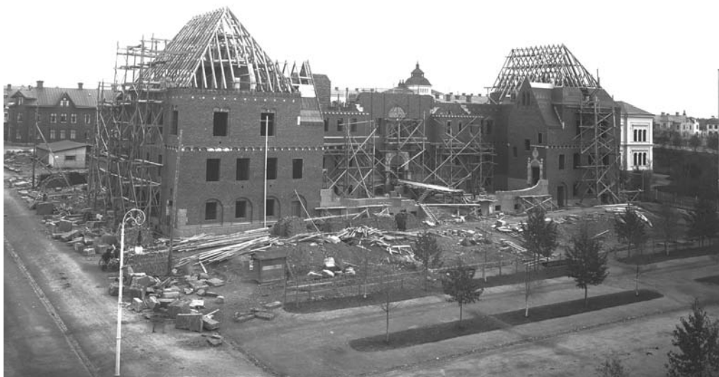
Tre år tog det att bygga rådhuset. Bilden är tagen den fjärde oktober 1910 då man håller på med murningsarbetet på andra och tredje våningen.