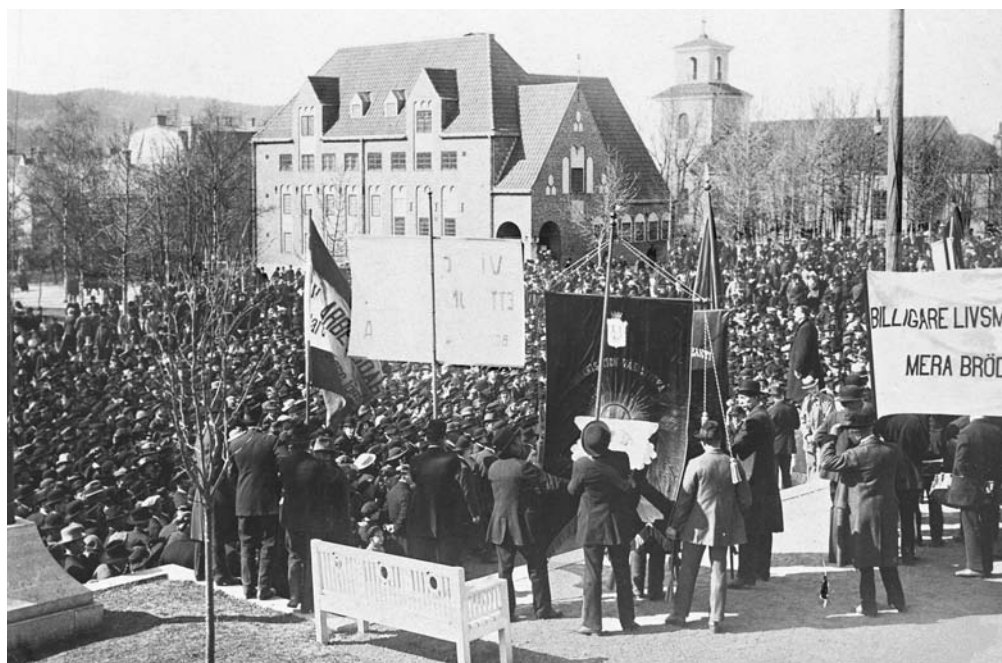
Massiv uppslutning på rådhusplan första maj 1917. Världskriget hade skapat matbrist och revolutionen i Ryssland påverkade stämningen i hela Europa. De styrande darrade, men allt avlöpte lugnt.

Eftersom ingen vid den här tiden kunde ana hur myndigheterna skulle komma att växa, så var man övertygad om att rådhusets rum skulle räcka och bli över i tid och evighet. För att säkra hyresinkomsterna såg därför stadens styrande till att hyresgästerna skrev livstidskontrakt. De flesta hyresgäster flyttade dock iväg frivilligt när den växande administrationen så småningom gjorde lokalerna för trånga.