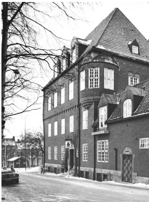
I rådhusets högra (södra) tornbyggnad och flygel fanns polisstation och arrestlokal ända fram till 1970. Då revs flygeln för att ge plats åt en modern byggnad. Foto från 1969.

”Rådhuset skulle bli den slutgiltiga manifestationen av den växande staden.”