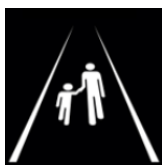
Gång- och cykelbanor