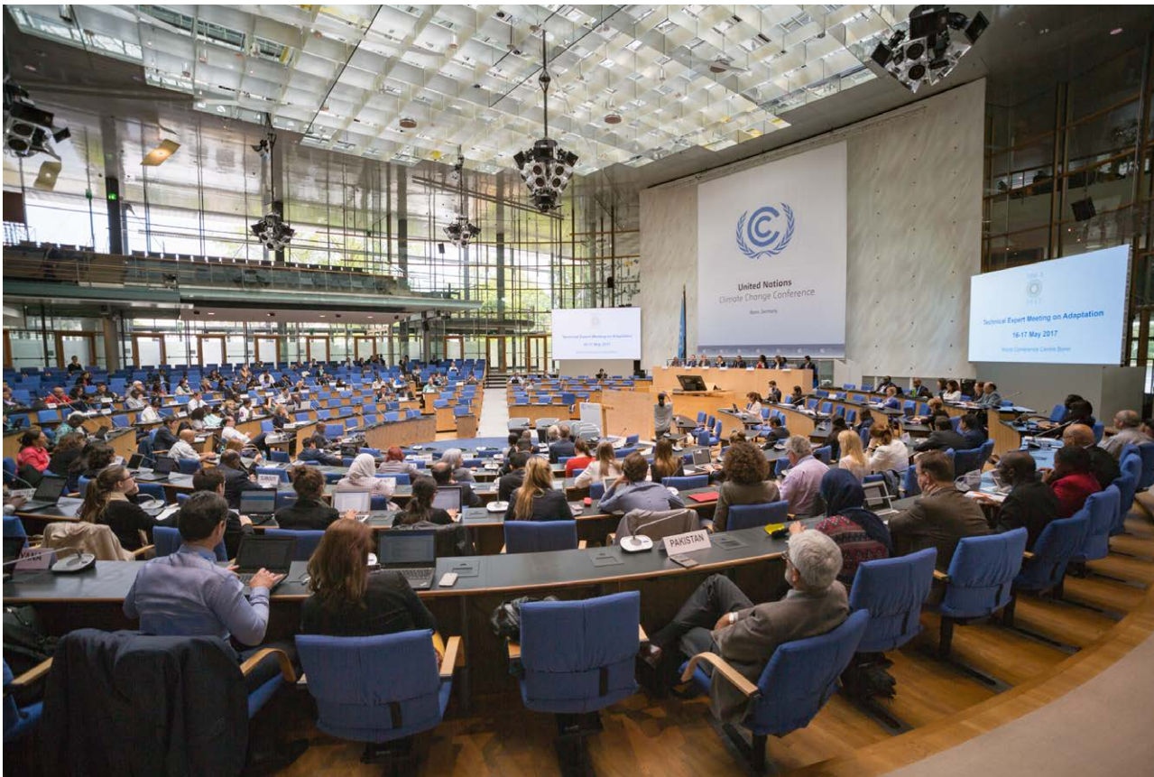
COP 23 – UN Climate Change Conference November 2017.

kommer en mer grundläggande analys av detta komma i IPCCs Assessment Report 7. Tills vidare, för att inte behöva riskera att krympa budgeten senare, har vi därför valt att ha kvar AR6 som utgångspunkt vid beräkning av budgetar och utsläppsminskningstakt. Det skulle då potentiellt innebära att utsläppsminskningstakten i denna rapport ökar sannolikheten för att nå betydligt under för 2,0 gradersmålet och att nå 1,5 gradersmålet.