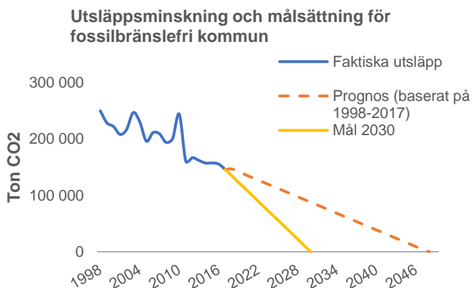
Figur 1. Faktisk utsläppsminskning, målsättning och prognos för Östersunds kommun.

Fram till 2030 behöver minskningen av fossil koldioxid i genomsnitt vara minst ca 11 200 ton per år för att fossilfrihet ska nås.