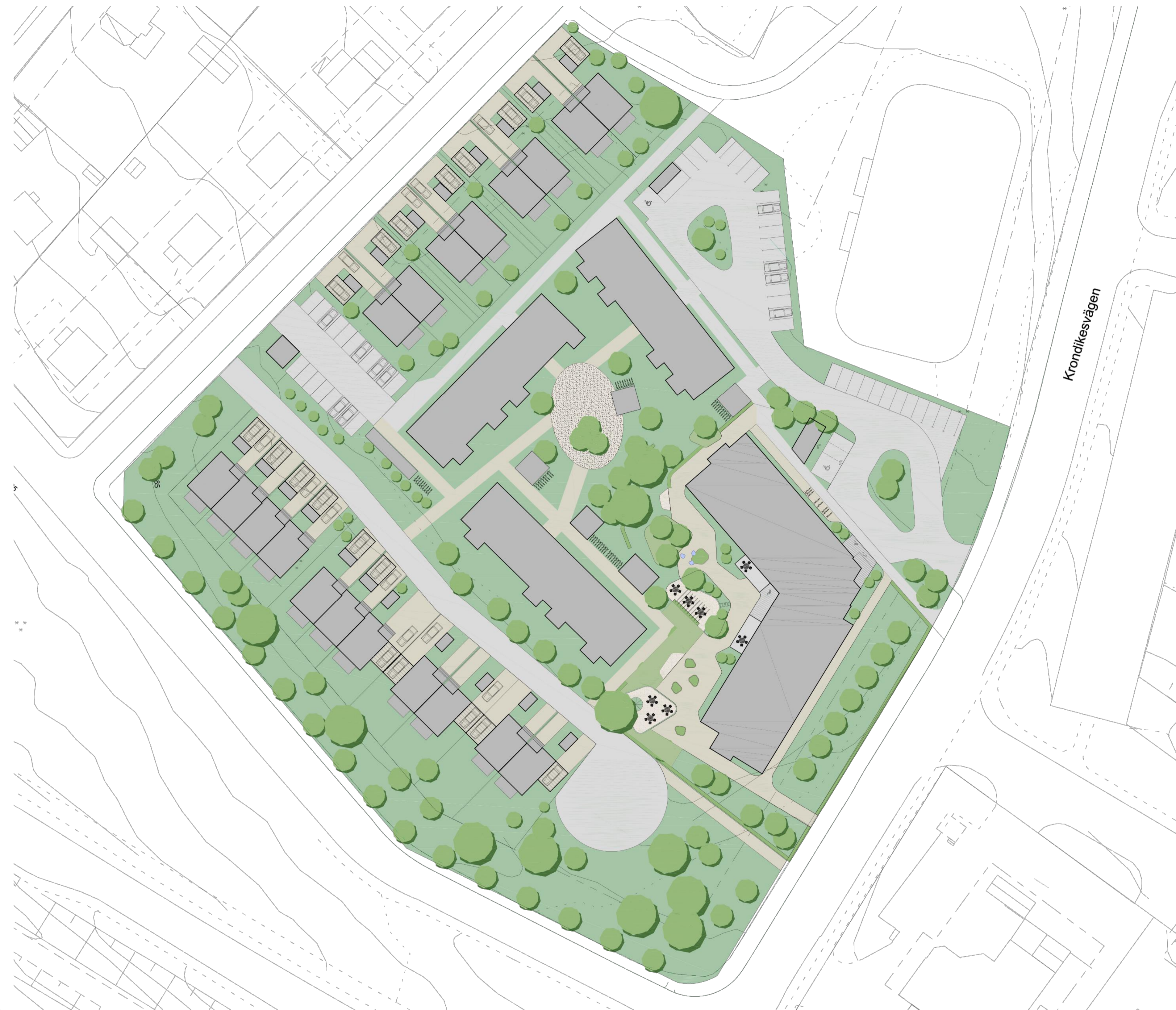
Illustration av ALoCo AB