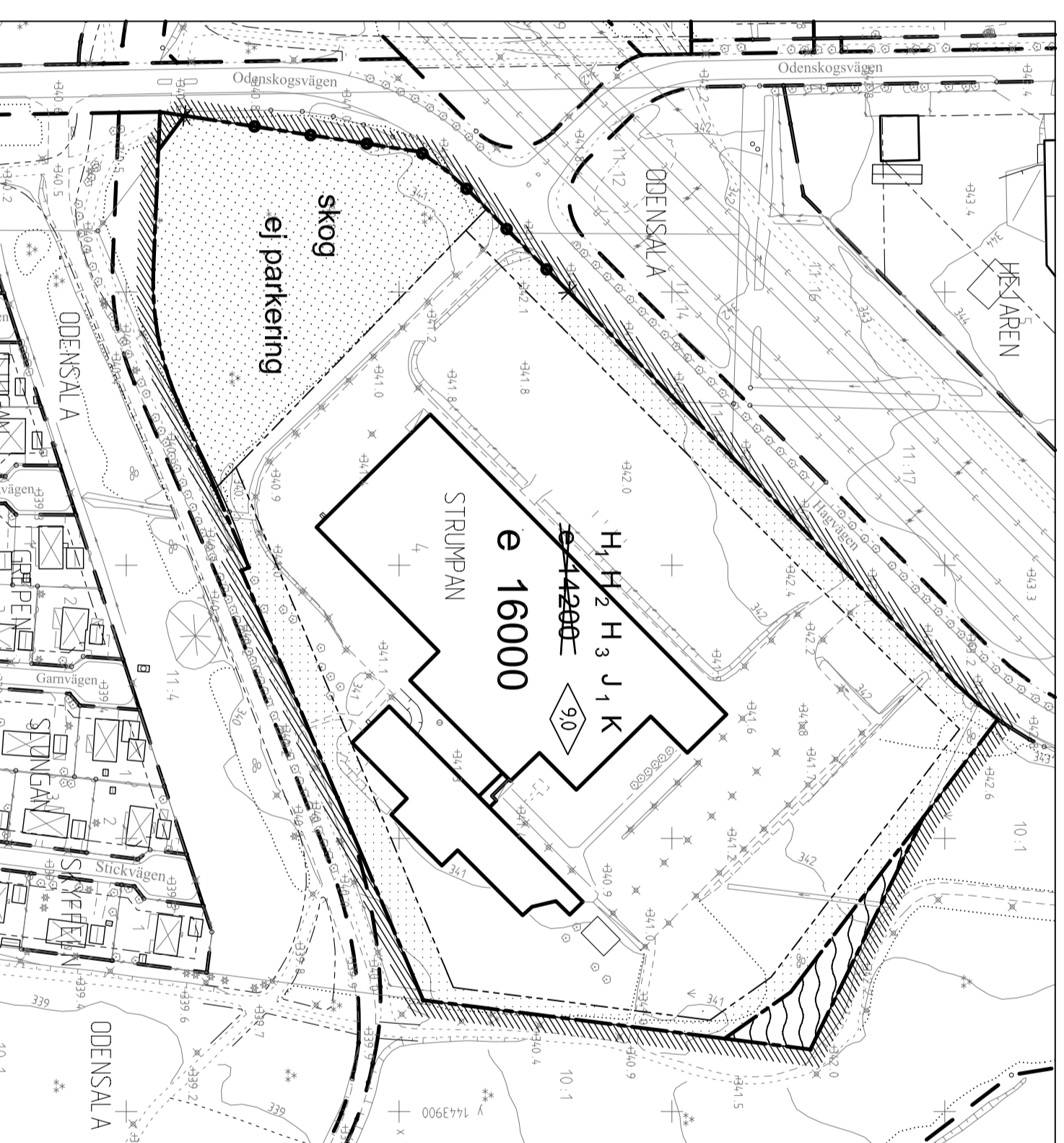
Tillägg till plankarta

Varumottagningen till Beijers kommer att flyttas till den nya lagerhallen. Logistiken inom området kommer att förbättras och risk för olyckor mellan besökare och backande fordon som lossar varutransporter minskar därmed. (se illustration)