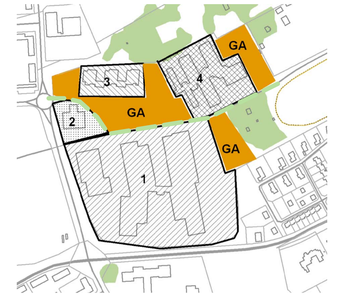
Lämplig fastighetsindelning med tillhörande gemensamhetsanläggning.