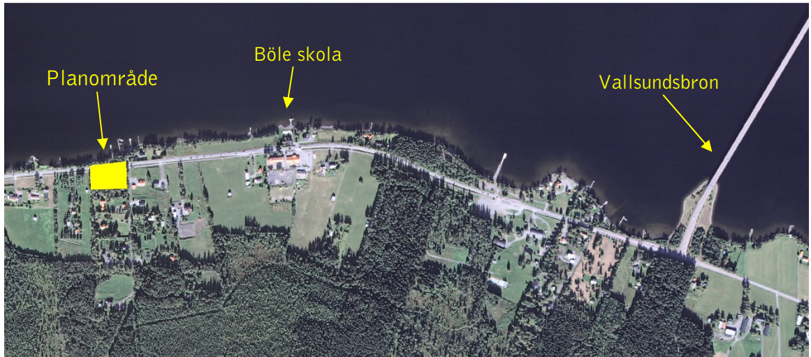
Bild 1. Karta som visar var planområdet ligger.