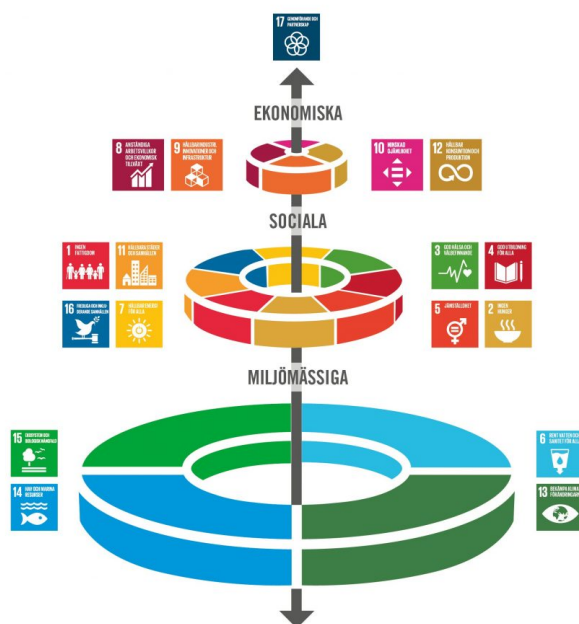
Bild 1. De tre dimensionerna av hållbar utveckling 9